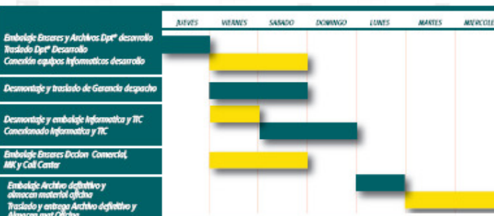
Gráfico de Actividad

Llevando a buen término en tiempo y forma lo que se ha comprometido. Para nosotros lo importante es tener un cliente para siempre que confíe en Grupo Amygo y nos pueda recomendar con total garantía